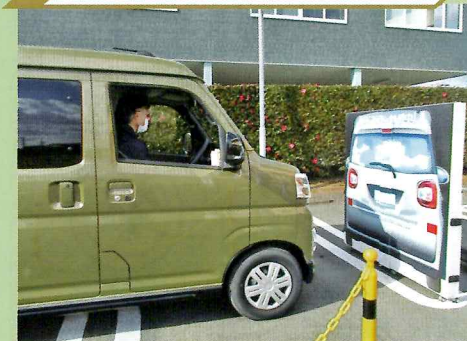
サポートカー体験教室