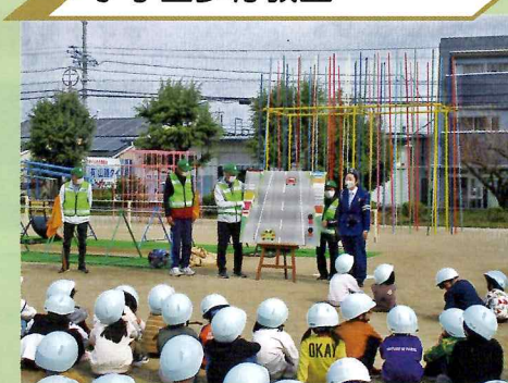
小学生自転車教室