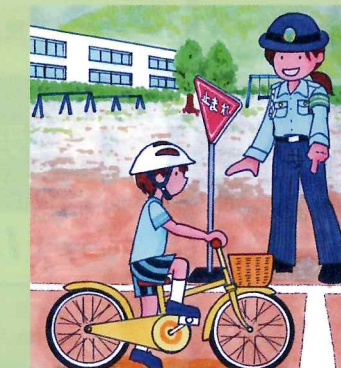
中学生自転車教室