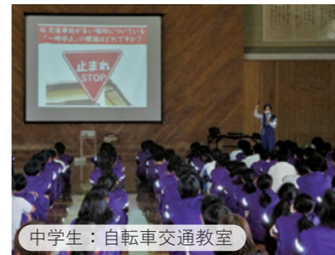
中学生：自転車交通教室