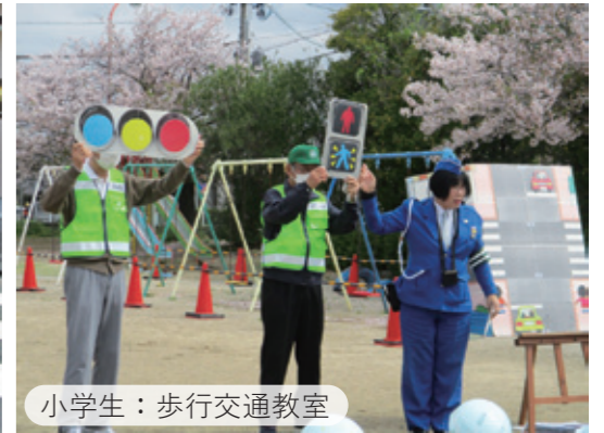
小学生：歩行交通教室