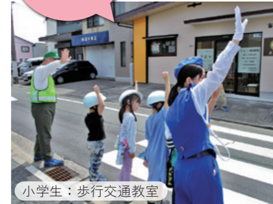
小学生：歩行交通教室