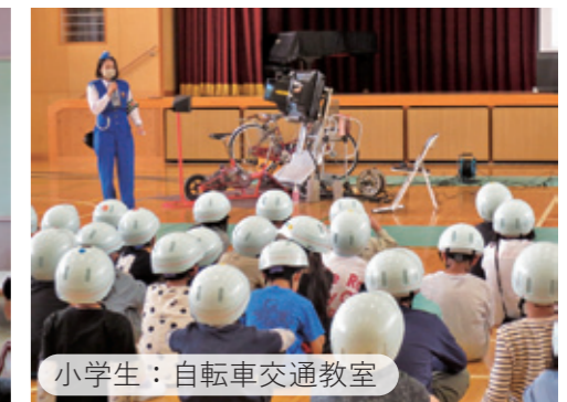
小学生：自転車交通教室