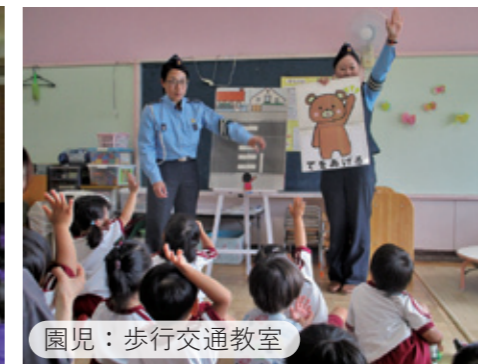
園児：歩行交通教室