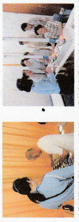
高齢者交通安全教室 (シニアアクトアグリ倶) 高齢者交通安全教室 (河東地区)