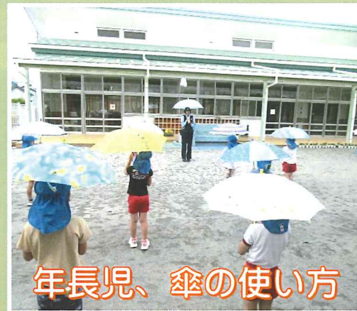
年長児、傘の使い方