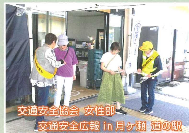
交通安全協会 女性部

高齢者講習では、参加者の普段の交通手段に合わせて講習をします。ご自身の俊敏性を測れる機材の体験もできます。