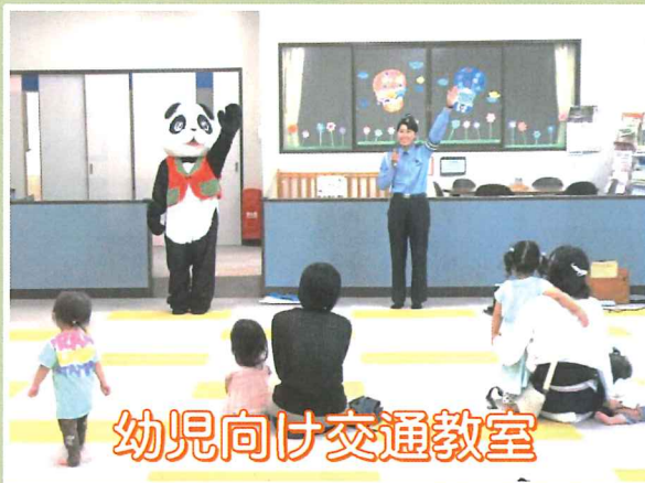
幼児向け交通教室