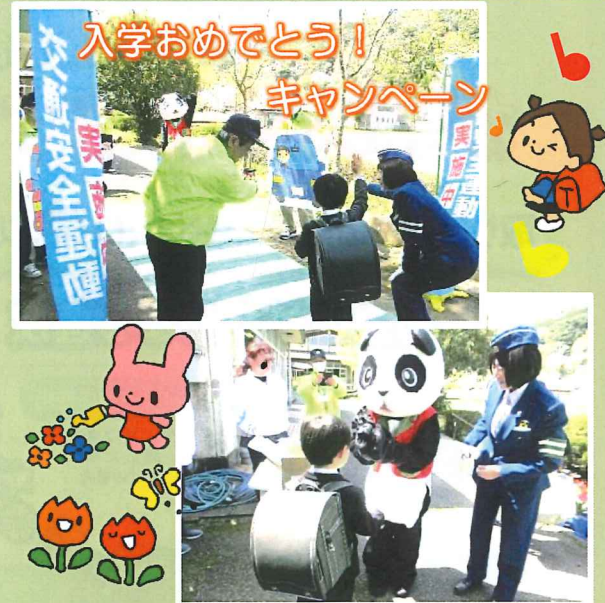
入学おめでとう！ キャンペーン