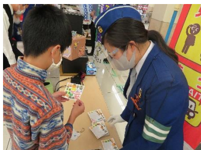
各種イベントへの参加