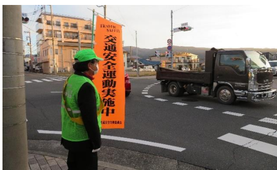
安全運動街頭広報（2年度は規模を縮小して実施した）