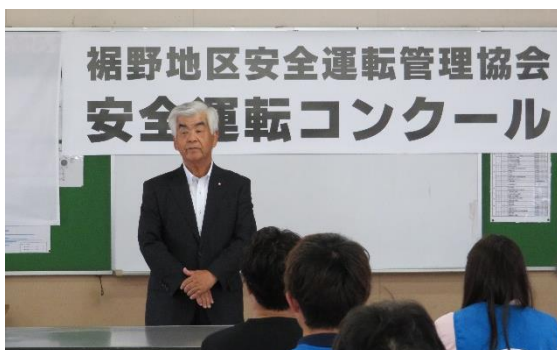
安全運転コンクール（令和元年度の様子）

安全運転管理協会の活動は、協会の活動にご理解していただいた会員の方々のご協力により運営させていただいています。