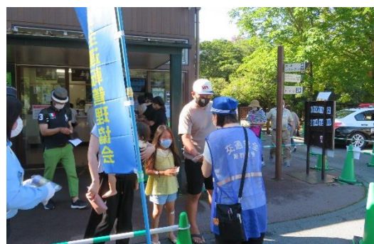
交通安全イベント（サファリパーク）

○ 会員を対象に各種表彰事業のほか重大事故発生通報、管内の交通事故発生状況などの発信、交通安全教育DVDの貸し出しなどを行っています。