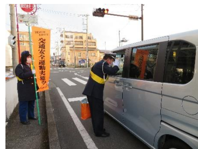
交通安全運動への参加