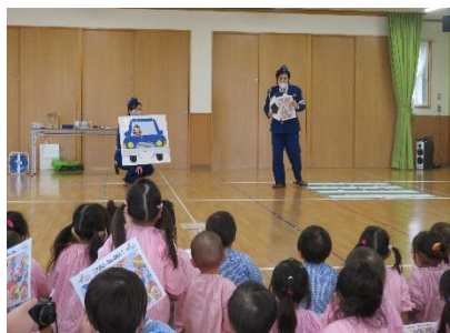
各年代に合わせた交通安全教室