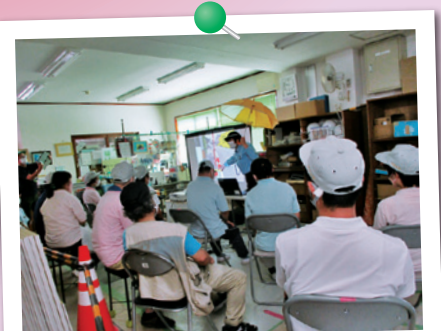
福祉施設歩行交通教室