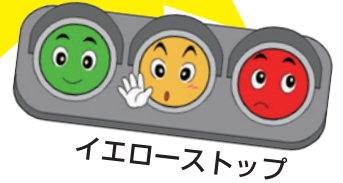
イエローストップ