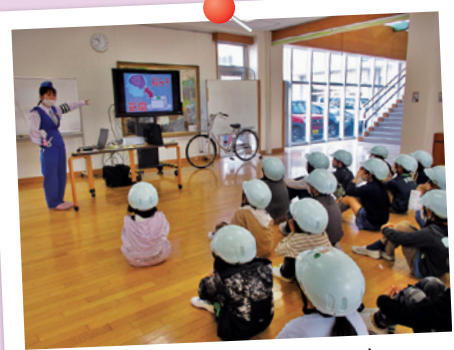
小学生自転車交通教室