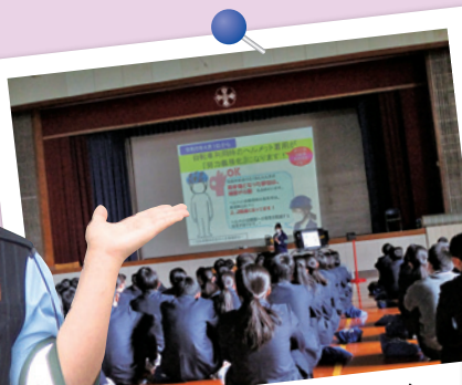
中学生自転車交通教室