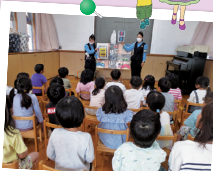
園児歩行交通教室