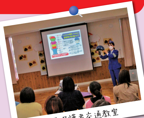
園児保護者交通教室