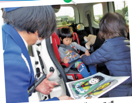
チャイルドシート着用指導