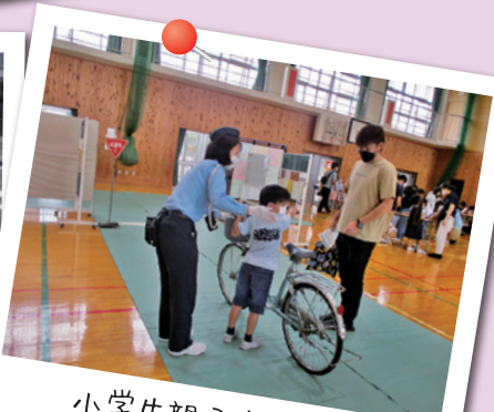
小学生親子交通教室