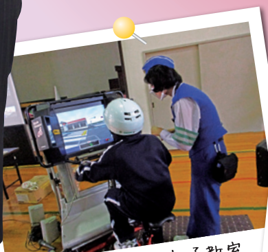
自転車体験型交通教室