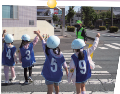
小学生歩行交通教室