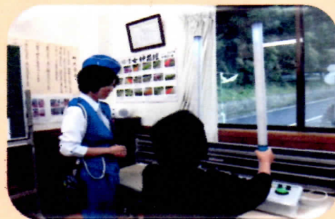
交通安全器材を使用して 自身の俊敏性をチェック！など