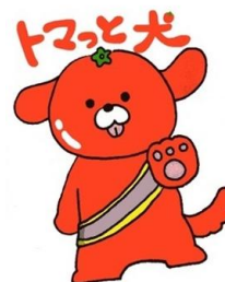
交通安全協会焼津地区支部キャラクター

免許更新時のあなたの会員加入が交通安全活動を支えています。 交通安全協会会員への加入にご協力をお願いします！