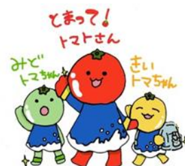
当支部キャラクター

交通事故は、決して他人事ではありません！ いつ、どこで自分の身に降りかかるかわかりません。交通事故を起こしてしまった方、被害に遭われた方、どちらも心に傷を負い、その交通事故が大きければ大きい程、心の傷も大きくなります。