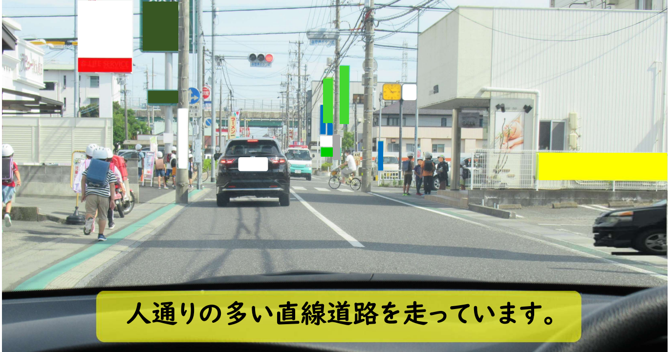
人通りの多い直線道路を走っています。