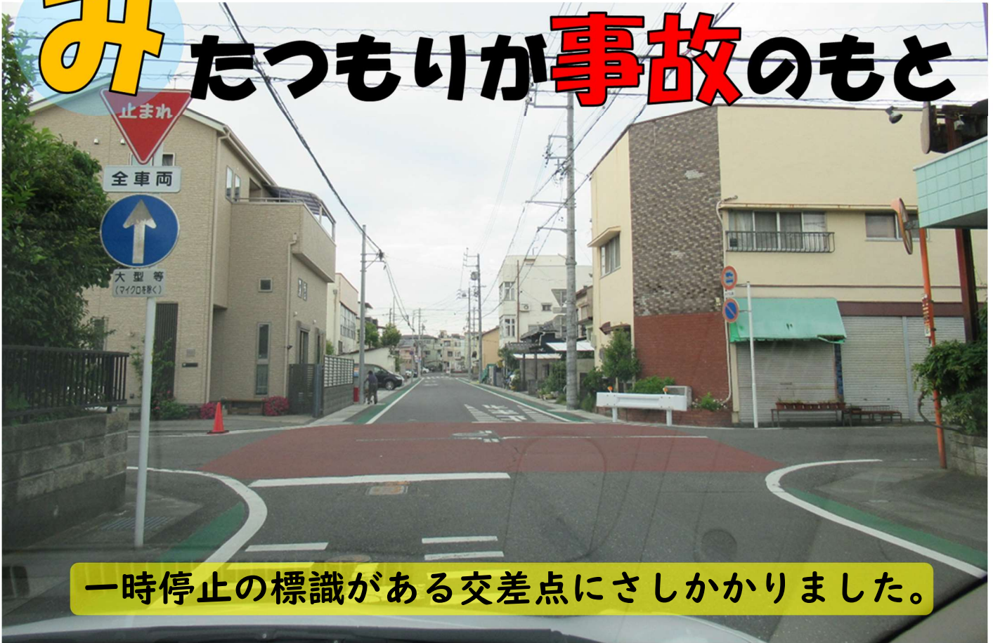
一時停止の標識がある交差点にさしかかりました。