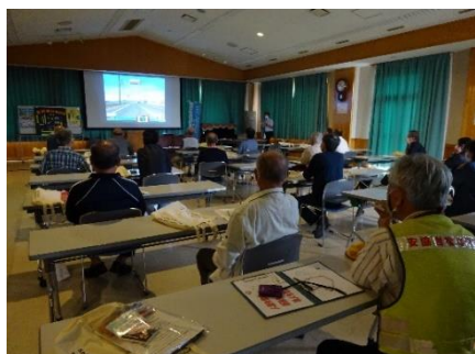
岩松北地区 KYT 講習会