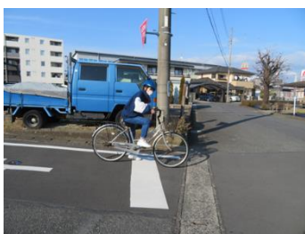
交差点の角でもう一度止まって安全確認