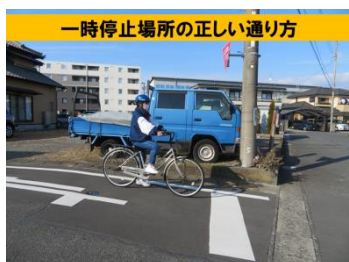
停止線の手前で止まる