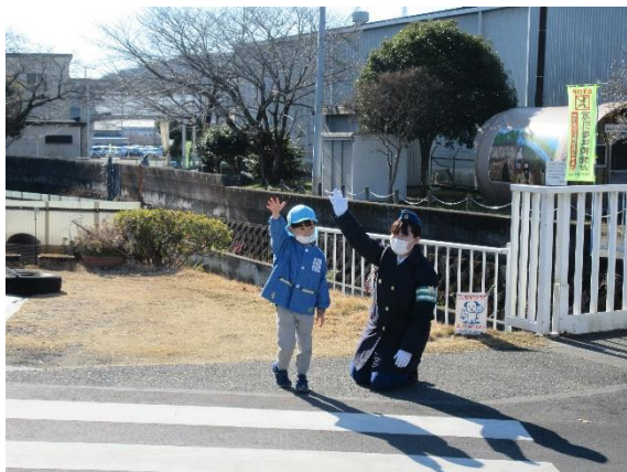
てんま保育園 歩行交通安全教室