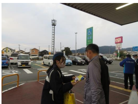
死亡事故発生に伴う広報啓発活動