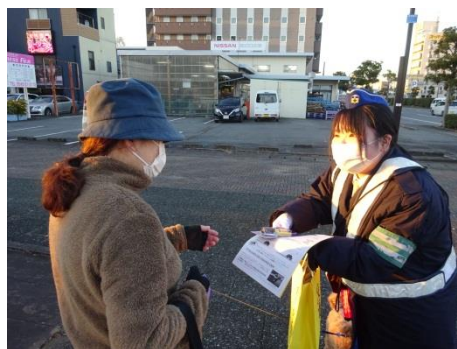
夕暮れ時のライトオン作戦 街頭広報活動