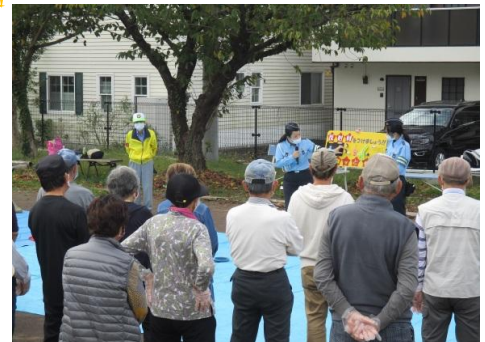
<10.15 三島市北上地区 シニアクラブ連合会輪投げ大会>