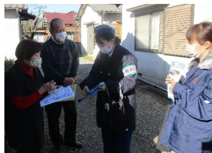
<12月15日 二人三脚高齢者訪問>